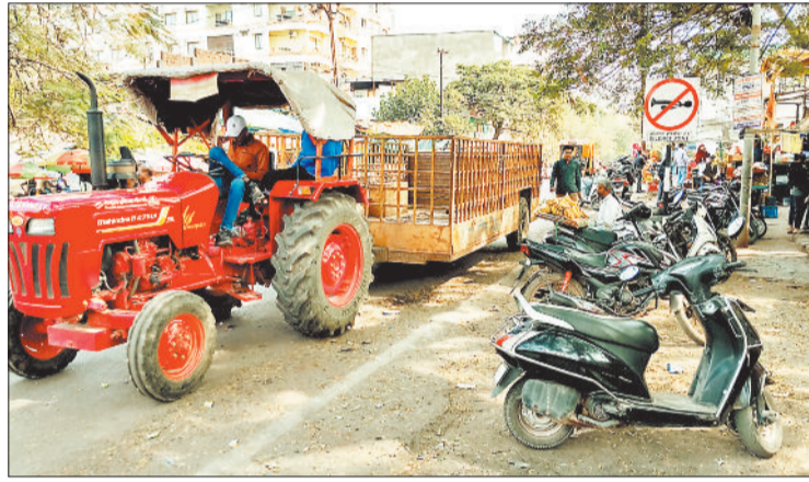
बृहस्पति बाजार चौक पर खड़ा रहा अतिक्रमण का दस्ता।