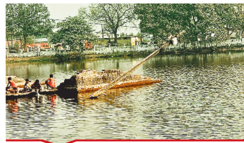
चकरभाटा बस्ती के तालाब के बीच झुका विद्युत पोल ।

[ बिल्हा | मस्टूरी | तखतपुर | मुंगेली | कोटा | लोरनी | सरगांव | पेंड़ा | बेलतरा | रतनपुर | पथरिया ]