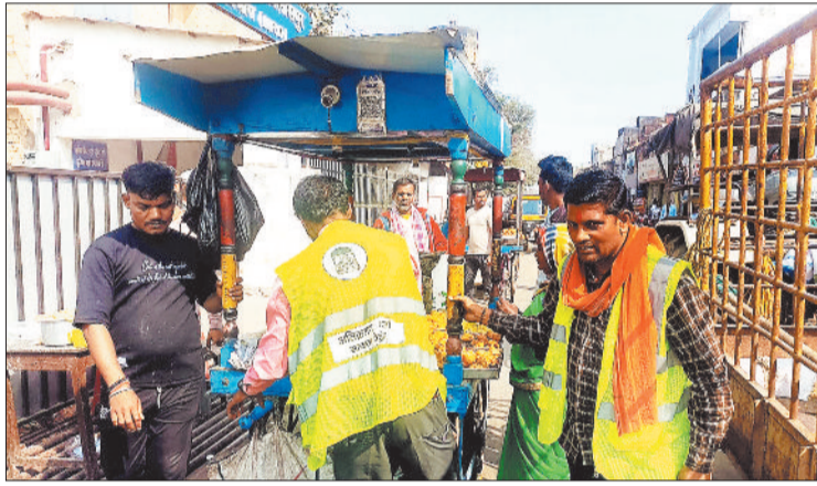
सिम्स के सामने से हटाया गया अतिक्रमण।